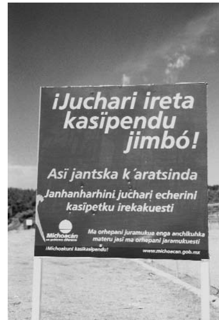
Campana de concientización a la limpieza, carretera entre Pichátaro y Cherán (Región de la Sierra purépecha).